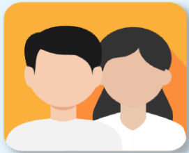
ผู้กู้ยืมเงินรายใหม่