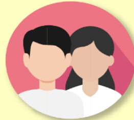
ผู้กู้ยืมเงินรายเก่าเปลี่ยนระดับ/ ย้ายสถานศึกษา/เปลี่ยนหลักสูตร หรือสาขาวิชา