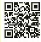
สแกนเพื่อเข้าเรียน e-Learning

• เนื้อหาเข้าใจง่าย • เรียนรู้กับผู้เชี่ยวชาญ • รองรับการใช้งานทุกอุปกรณ์ • เรียนครบ สอบผ่าน ได้รับ e-Certificate