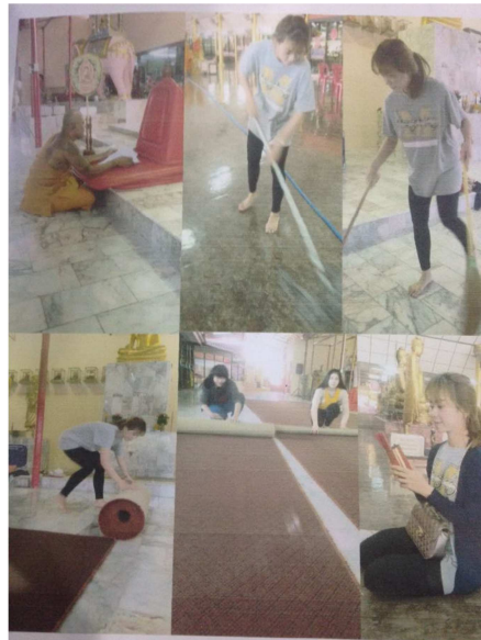
ภาพที่ 3 ภาพที่นักศึกษาถ่ายกับผู้ดูแลการทำมาสะอาด (ถ้ามี) จำนวน 1 ภาพ