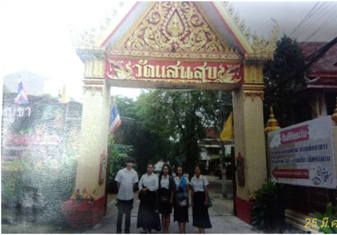
ภาพที่ 1 ภาพที่นักศึกษาถ่ายกับสถานที่ที่ไปทำการทำความสะอาดให้เห็นป้ายสถานที่ และนักศึกษาอย่างชัดเจน จำนวน 1 ภาพ