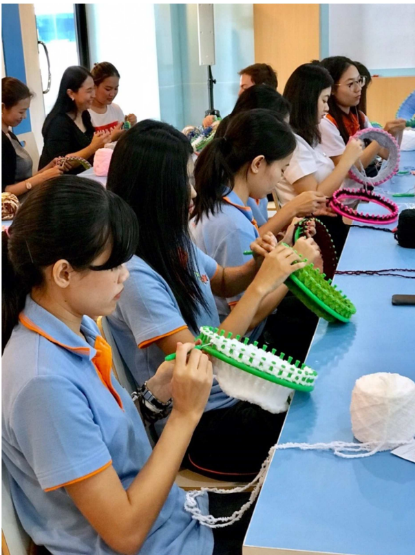
ภาพขณะทำกิจกรรม (ถ้ามีคนถ่ายให้)