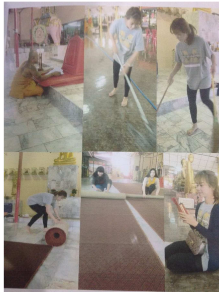
ภาพที่ 3 ภาพที่นักศึกษาถ่ายกับผู้ดูแลการทำมาสะอาด (ถ้ามี) จำนวน 1 ภาพ