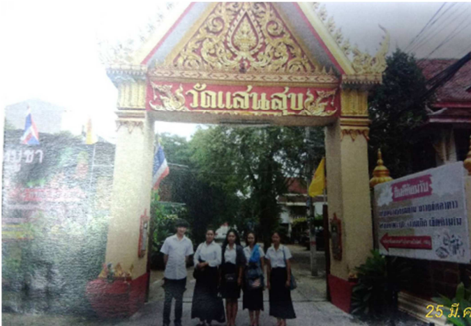
ภาพที่ 1 ภาพที่นักศึกษาถ่ายกับสถานที่ที่ไปทำการทำความสะอาดให้เห็นป้ายสถานที่ และนักศึกษาอย่างชัดเจน จำนวน 1 ภาพ